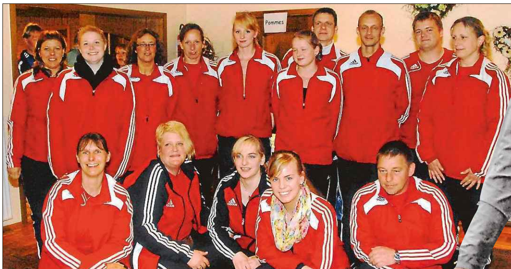
Die Frauen I aus Bensorsiel werfen in der nächsten Saison in der Bezirksklasse.

Im Vergleich der Männer wurde der Norder Kreismeister Großheide als hoher Favorit gehandelt. Mit der Holzkugel wurde der Favorit seiner Rolle gerecht. Mit der Gummikugel schwächelte er auf dem letzten Ende und wurde von Utgast und Norden noch abgefangen. „Fresena“ Utgast siegte letztlich mit 13 Metern Vorsprung in der Holzwertung. Die Gummigruppe des Esenser Vertreters ließ der Konkurrenz keine Chance und siegte mit vier Wurf. Leerhafe als Vierter und Uttel als Siebter mussten die Hoffnungen auf das Startrecht in der Landesliga hingegen begrä-